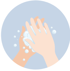
Palm to palm يدا بيد