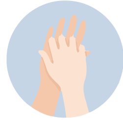
Between your fingers بين أصابعك